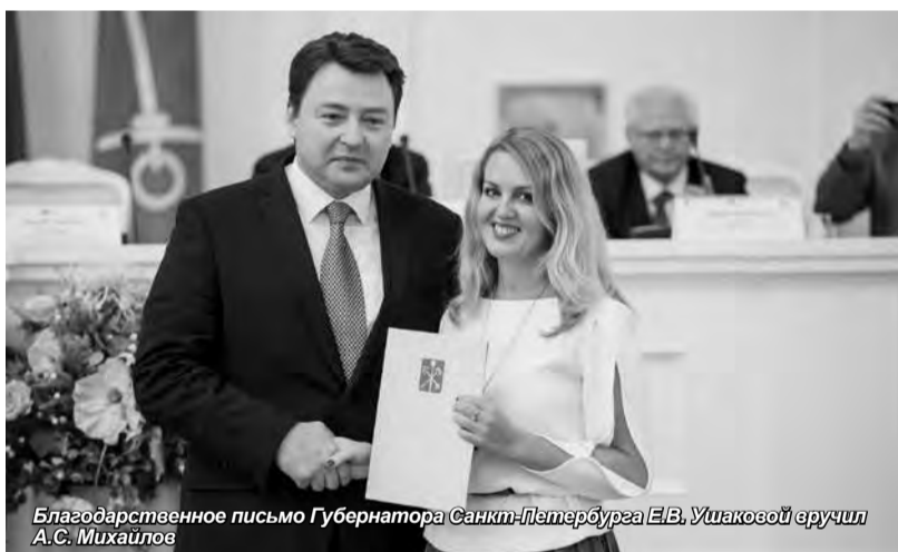
Благодарственное письмо Губернатора Санкт-Петербурга Е.В. Ушаковой вручил А.С. Михайлов

Вице-губернатор Санкт-Петербурга А.Н. Говорунов отметил, что для развития человечества, страны и города необходимы образованные, быстро адаптируемые и креативные люди. «Появившаяся 20 лет назад программа имеет нацелен-