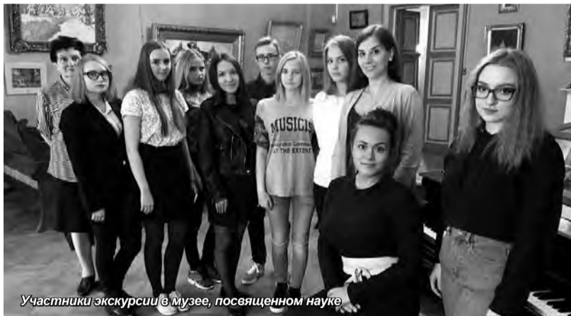
Участники экскурсии в музей, посвященном науке

Ученый создал крупнейшую в России физиологическую школу и сделал ряд весомых открытий в области регуляции пищеварения. Следует отметить, что в области познания функций мозга Павлов принадлежит едва ли не самый серьезный вклад за всю историю. Применение его научных методов позволило приоткрыть завесу тайны душевных заболеваний и наметить возможные пути их успешного лечения. В апреле 1890 года Павлова избрали профессором фармакологии сразу в два университета: Варшавский и Томский. А в 1891-м его пригласили для организации отдела физиологии в только что открывшемся