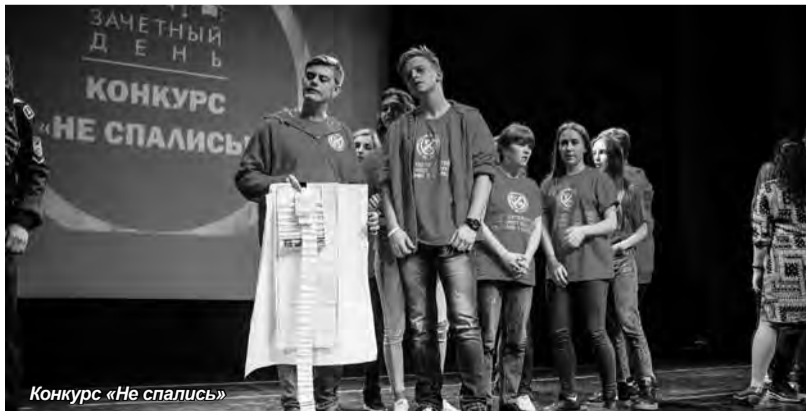
Конкурс «Не спались»

Первокурсники Санкт-Петербургского университета технологий управления и экономики получили почетную грамоту «Самая дружная команда», а звание абсолютного победителя досталось команде из ЦПИВ. Каждый участник остался под впечатлением от такого насыщенного вечера.