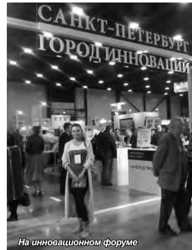
На инновационном форуме

теля, действующее конвейерное производство, инновации в области системы очистки воды на наноуровне, знакомство с роботом Алантимом. Необычный со-