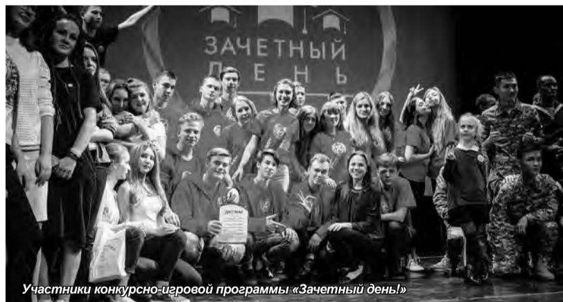
Участники конкурсno-игровой программы «Зачетный день!»

Первокурсники приняли участие в конкурсno-игровой программе