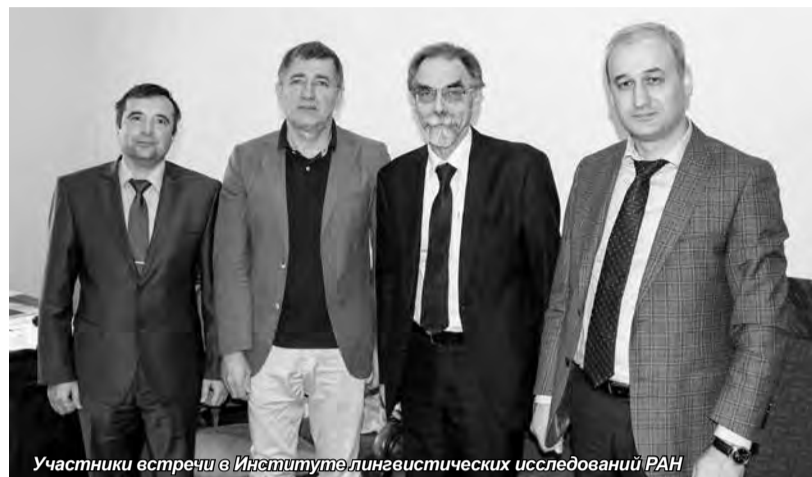
Участники встречи в Институте лингвистических исследований РАН