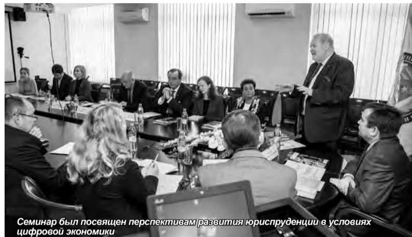
Семинар был посвящен перспективам развития юриспруденции в условиях цифровой экономики