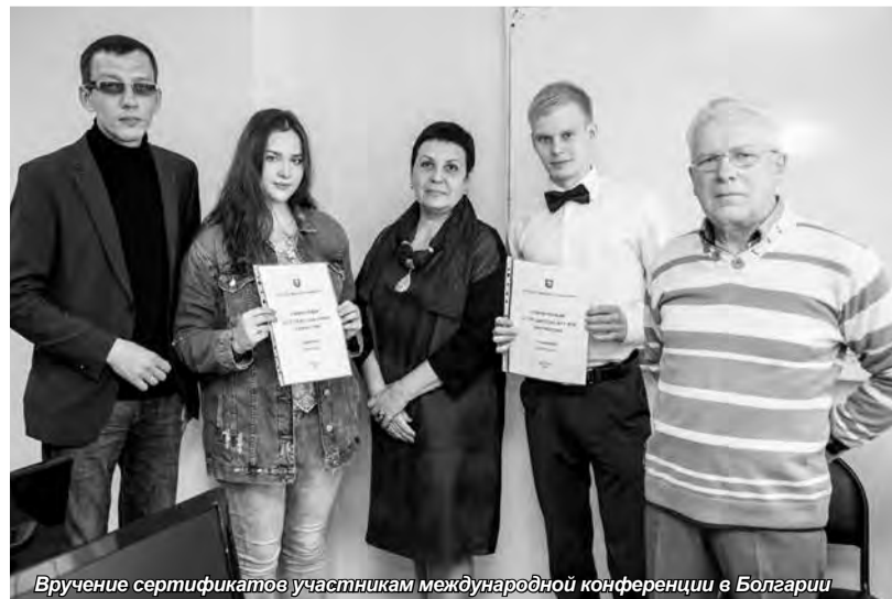
Вручение сертификатов участникам международной конференции в Болгарии

В заключение своего выступления директор института поблагодарил «школьников» за их достижения в исследовательской работе в прошедшем году, предложил помощь в реализации намеченных творческих планов, если таковая потребуется, и подчеркнул заинтересованность в продолжении работы исследовательского коллектива.