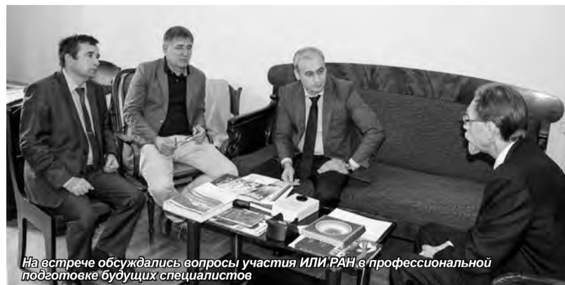
На встрече обсуждались вопросы участия ИЛИ РАН в профессиональной подготовке будущих специалистов

Особо важными стали вопросы возможности прохождения студентами практик в Институте лингвистических исследований РАН и проведение его исследователями в стенах Университета открытых лекций. В рамках данного взаимодействия предлагается расширить область знаний студентов Университета, повысить качество их подготовки и будущей профессионализм.