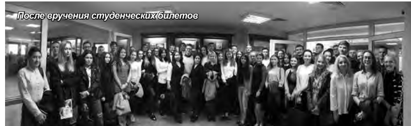
После вручения студенческих билетов