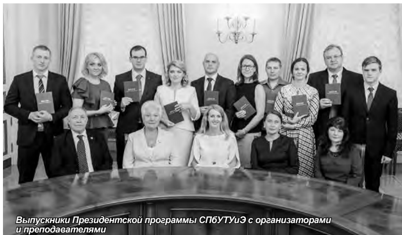
Выпускники Президентской программы СПбГУиЭ с организаторами и преподавателями