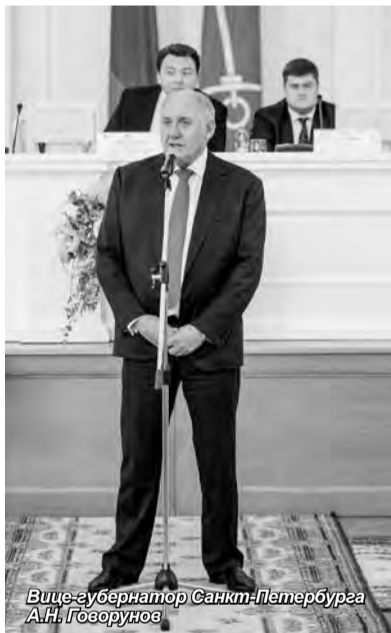
Вице-губернатор Санкт-Петербурга А.Н. Говорунов

Дипломы выпускникам Президентской программы подготовки управленческих кадров вручили 29 сентября в актовом зале Смольного