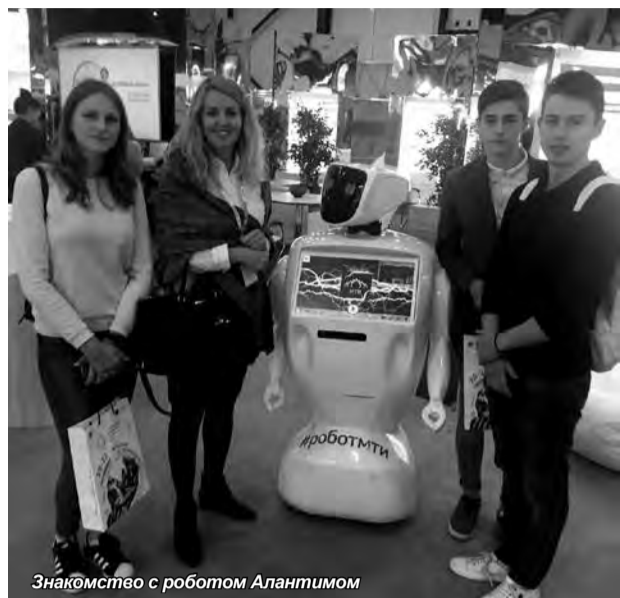
Знакомство с роботом Алантимом

Студенты приняли участие в Международном форуме «Российский промышленник» и Петербургском международном инновационном форуме