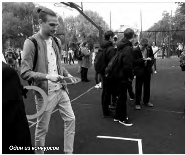
Один из конкурсов

На мероприятии были представлены различные подростково-молодежные клубы и секции Адмиралтейского района: от творческих мастерских по обучению современной хореографии, вокалу и народной песни, до курсов по морской подготовке, судомоделированию и водному