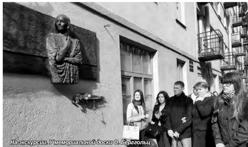
На экскурсии. У мемориальной доски О. Бергольц

В субботу, 16 сентября, первокурсники Института международных программ отправились на экскурсию с необычным названием «Неформальный Петербург», организованную Санкт-Петербургским Домом молодежи.