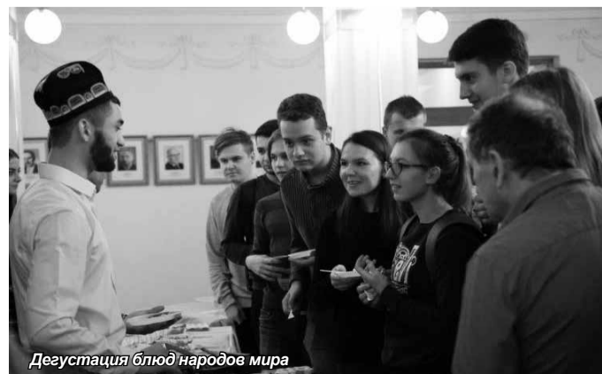
Дегустация блюд народов мира

Выражаем признательность организаторам форума «Палитра языков и культур», студентам, подготовившим такие незабываемые выступления! Желаем дальнейших творческих успехов в проведении таких интересных, увлекательных мероприятий.