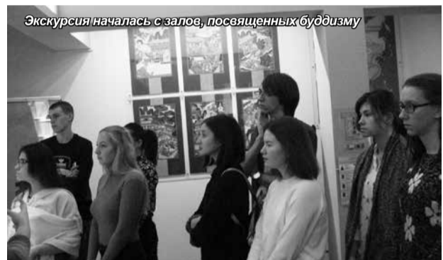
Экскурсия началась с залов, посвященных буддизму