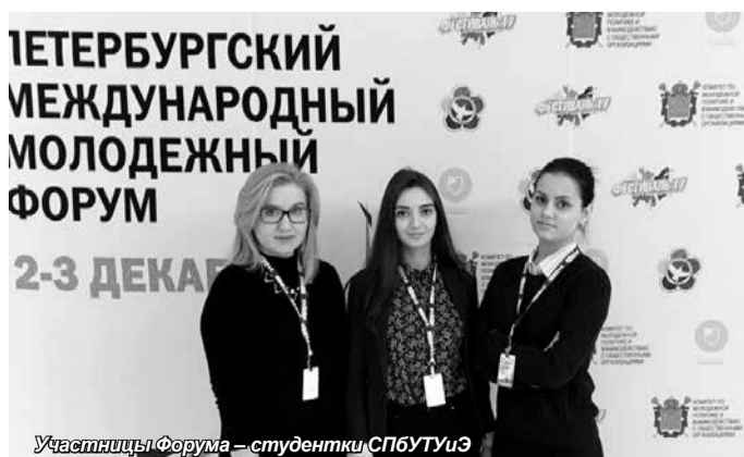
Участницы Форума – студентки СПбГУиЭ

По моему мнению, молодежь – самая активная и мобильная часть общества, и от нашего желания принести пользу во многом зависит процветание страны. России нужны образованные, инициативные и творческие люди, способные принимать смелые решения и воплощать их в жизнь.