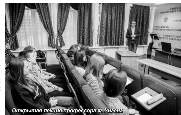
Открытая лекция профессора Ф. Унгена

языке на тему «Международный контекст для развития в области финансов и управления» (International Context for Development in Finance and Management).