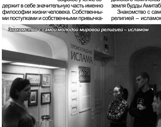
Знакомство с самой молодой мировой религией – исламом

Полтора часовая экскурсия пролетела быстро и незаметно, и мы не спешили покинуть залы музея, продолжая знакомиться с уникальными экспозициями.