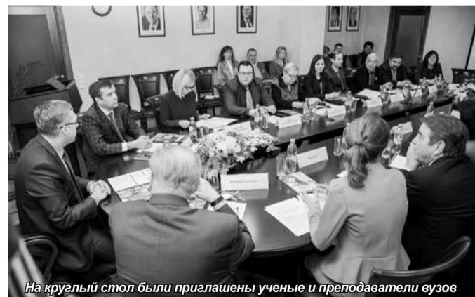
На круглый стол были приглашены ученые и преподаватели вузов