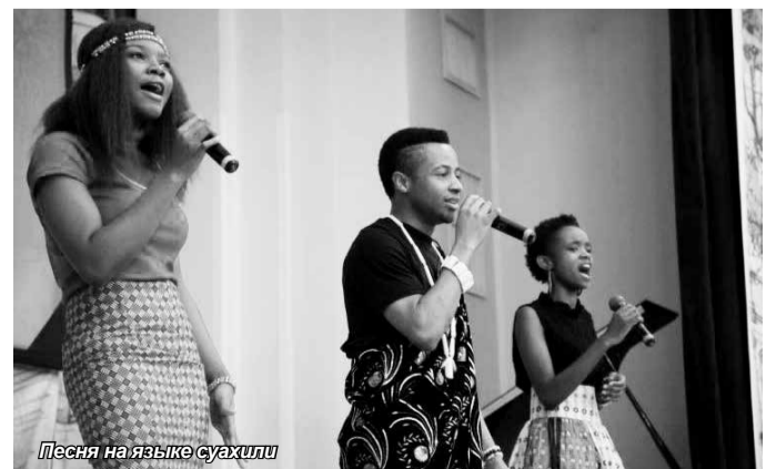
Песня на языке суахили