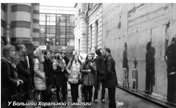
У Большой Хоральной синагоги

остановки – католическая церковь Святой Екатерины и лютеранская церковь Святых Петра и Павла, находящиеся в самом сердце Петербурга – на Невском проспекте. Эти храмы, принадлежащие разным христианским конфессиям, имеют особые отличия, которые проявляются даже в интерьере. В католической церкви можно ощутить атмосферу величия: среди колонн и возвышающихся над ними скульптурами ангелов располагается украшенный алтарь, церемонии и службы проходят торжественно, священнослужители имеют особый статус. В лютеранском же храме всё наоборот: простота убранства, строгость помещения, руководитель служб – человек, равный среди всех. Единственное сходство – это неопишущей красоты фасады церквей и вера их прихожан в Иисуса Христа.