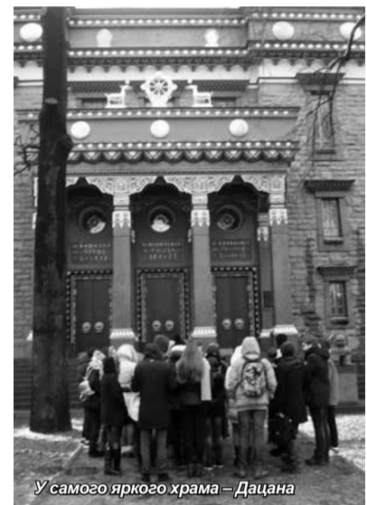
У самого яркого храма – Дацана