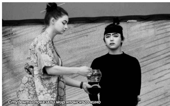
Студенты показали мир японского кино