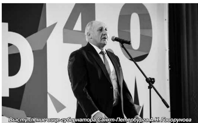
Выступление вице-губернатора Санкт-Петербурга А.Н. Говорунова