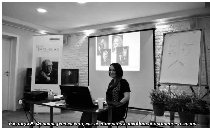
Ученицы В. Франкла рассказали, как логотерапия находит воплощение в жизни

нужно к осознанию не инстинктивного, а духовного в жизни человека. Лишь духовность, выраженная в реализации человеком своего смысла жизни, может привести к психическому здоровью.