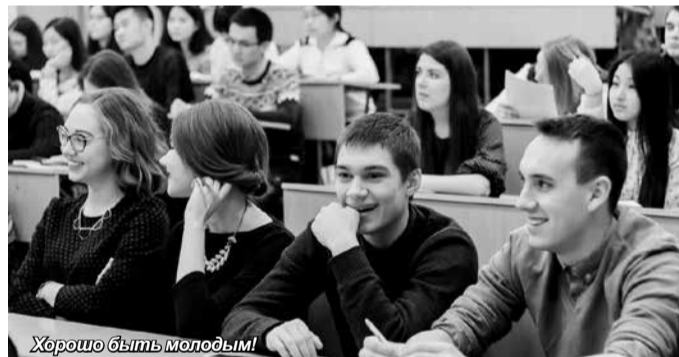
Хорошо быть молодым!