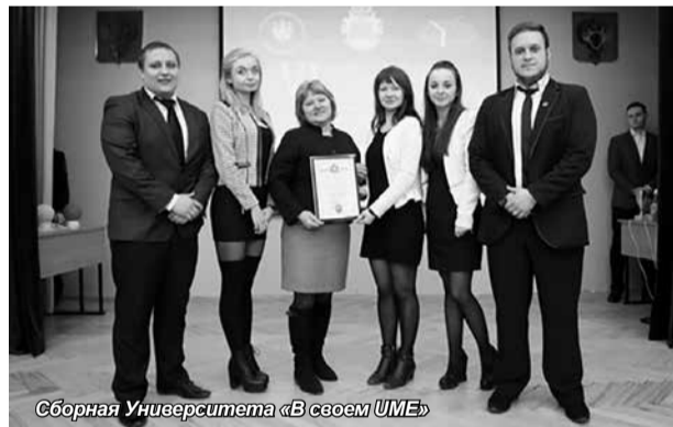
Сборная Университета «В своем УМЕ»

нении тестов, а также работе с криминалистической и уголовно-процессуальной терминологией. Завершилась олимпиада домашним заданием, в рамках которого команды продемонстрировали видеоматериалы о тактике производства отдельного следственного действия.