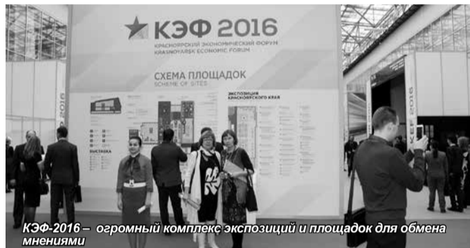
КЭФ-2016 – огромный комплекс экспозиций и площадок для обмена мнениями