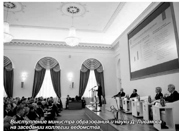
Выступление министра образования и науки Д. Ливанова на заседании коллегии ведомства

Рабочими группами Минобрнауки России продолжается оптимизация сети диссертационных советов. За последние два года их количество сократилось на 32,7%.