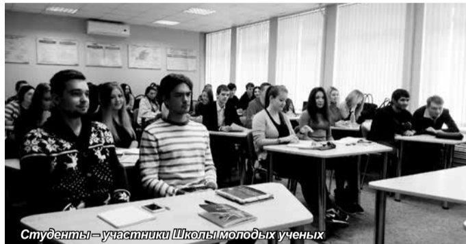
Студенты – участники Школы молодых ученых

Это было своего рода повторное слушание по указанным темам, ведь студенты уже выступали с этими докладами на втором заседании школы. На этот раз отработывались навыки риторики и проводилась дополнительная необходимая доработка текста доклада-сообщения каждым студентом с учетом выступлений на зарубежных конференциях.