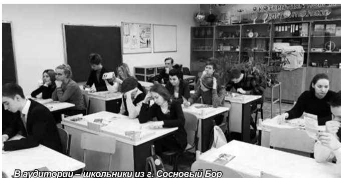
В аудитории – школьники из г. Сосновый Бор