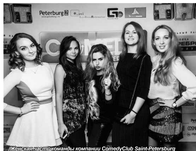
Женская часть команды компании ComedyClub Saint-Petersburg