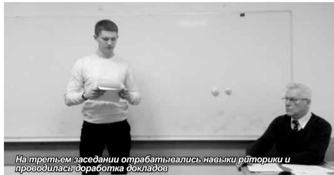
На третьем заседании отработывались навыки риторики и проводилась доработка докладов