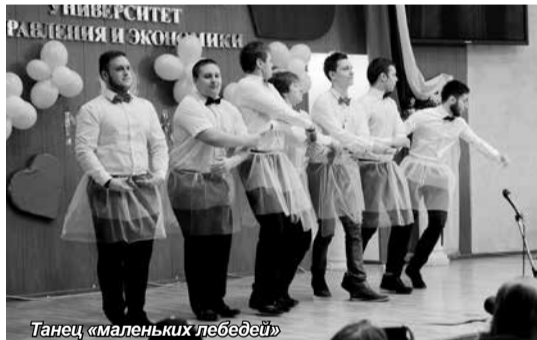
Танец «маленьких лебедей»