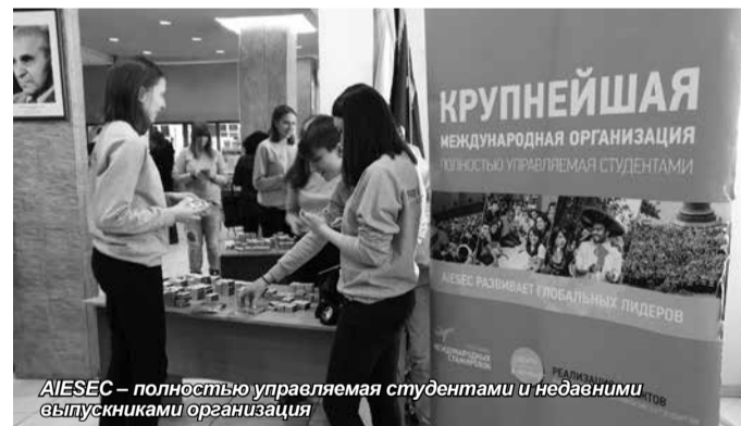
AIESEC – полностью управляемая студентами и недавними выпускниками организации

Информация Института международных программ