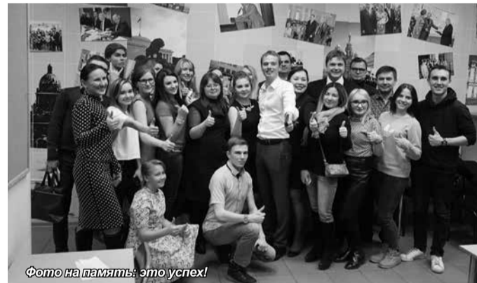
Фото на память: это успех!