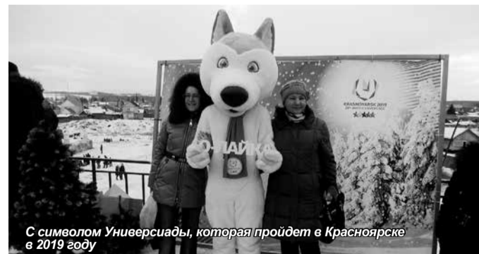
С символом Универсиады, которая пройдет в Красноярске в 2019 году