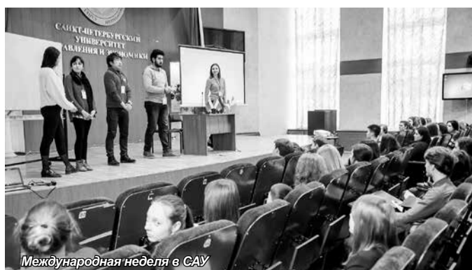
Международная неделя в САУ

Представители AIESEC вручили сотрудникам Университета благодарственное письмо за совместную работу над мероприятием. Также студенты были награждены сертификатами участников.