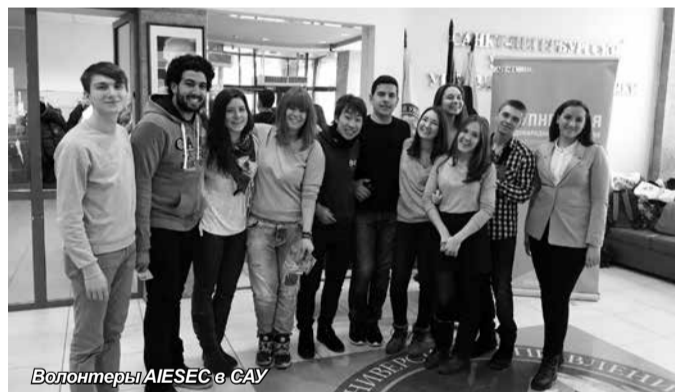
Волонтеры AIESEC в САУ