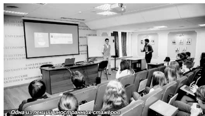
Одна из лекций иностранных стажёров