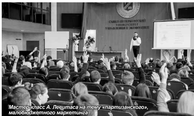
Мастер-класс А. Левитаса на тему «партизанского, малобюджетного маркетинга»