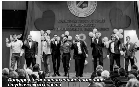
Попурри в исполнении сильной половины студенческого совета