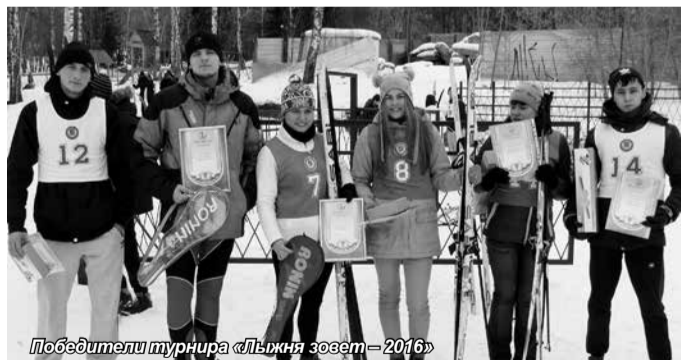
Победители турнира «Лыжня зовет-2016»