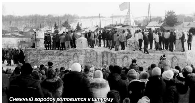
Снежный городок готовится к штурму