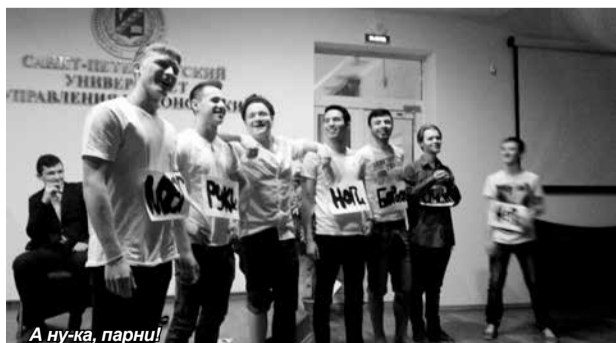
А ну-ка, парни!

8 марта – первый весенний праздник, объединяющий в себе всё то прекрасное, что заключается для нас в этом времени года – красоту и любовь, доброту и нежность,