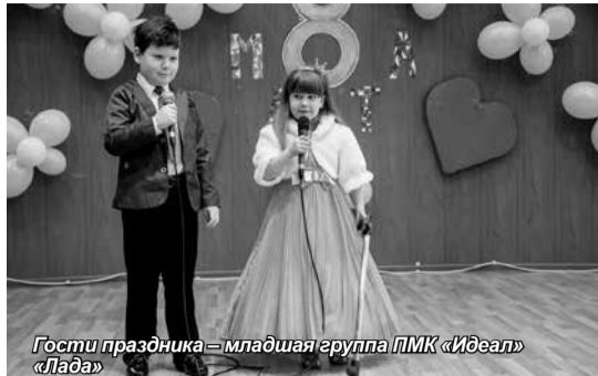
Гости праздника – младшая группа ПМК «Идеал» «Лада»