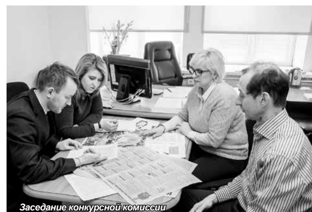
Заседание конкурсной комиссии

Хотелось бы поблагодарить всех участников конкурсов, пожелать им творческих успехов, дальнейшей реализации своего потенциала и успешного трудоустройства на предприятиях-партнерах института.