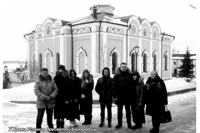
У Храма Успения Пресвятой Богородицы

Также мне бы очень хотелось упомянуть о святом исцеляющем источнике, который тоже находится на территории Свято-Иоанно-Богословского монастыря. Спускающаяся от монастыря проселочная дорога, огибая соседние холмы, приведет вас в небольшую рощицу – к Святому источнику, окунуться в котором для исцеления от различных болезней приезжают не только из самых дальних уголков России, но и со всего мира. Здесь есть колодец, купальни и новая пятиглавая часовня. Вы найдете и ветхий деревянный вход в древние пе-