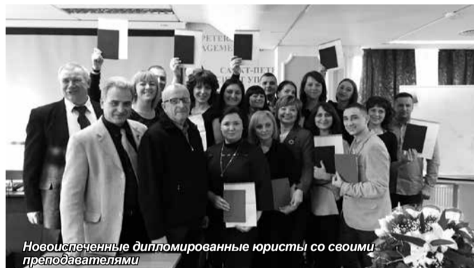
Новоиспеченные дипломированные юристы со своими преподавателями