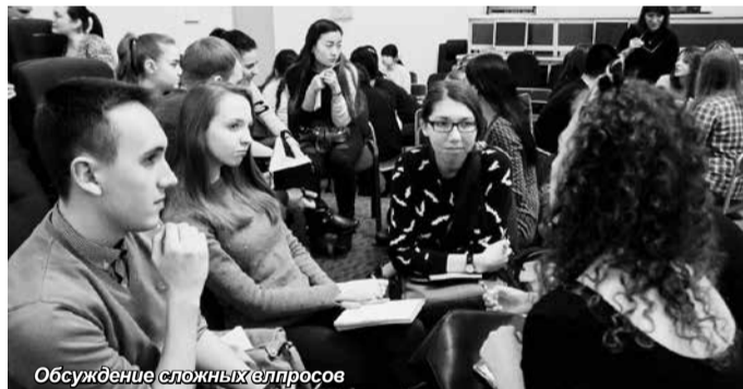
Обсуждение сложных вопросов

«Хорошо быть молодым!» – поется в известной песне Никитиных. Да, действительно, молодым быть хорошо! Впереди вся жизнь. И пусть она трудна, но, кажется, что у тебя все получится. И никто не станет с этим спорить. А вот легко ли быть молодым? Этот вопрос остается открытым.