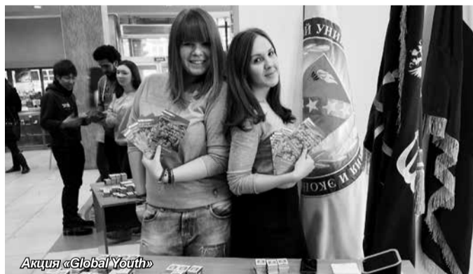
Акция «Global Youth»

Продолжается сотрудничество с международной молодежной организацией AIESEC