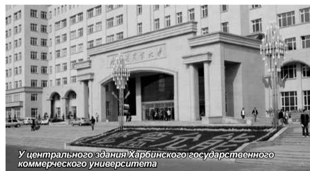
У центрального здания Харбинского государственного коммерческого университета

научно-исследовательской и издательской сферах было подписано с ректором Шаньдунского архитектурно-строительного университета Ван Чунцзе, во время визита китайской делегации в Санкт-Петербург.