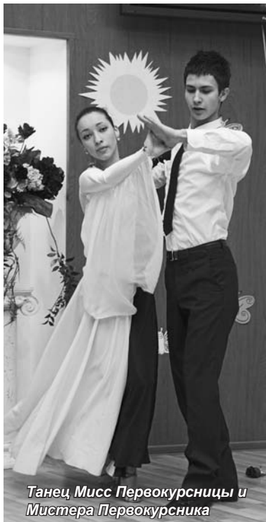
Танец Мисс Первокурсницы и Мистера Первокурсника