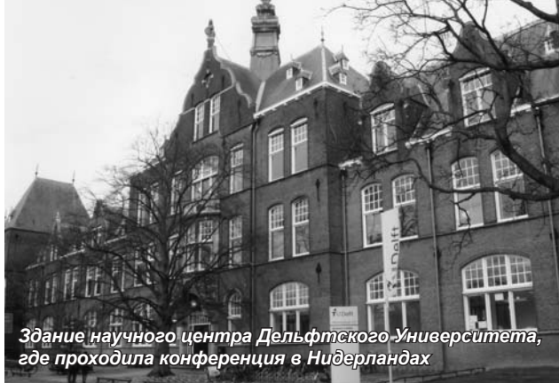
Здание научного центра Дельфтского Университета, где проходила конференция в Нидерландах

Программа конференции предусматривала обмен мнениями в рамках круглого стола о наиболее актуальных пробле-