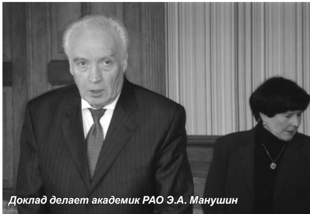
Доклад делает академик РАО Э.А. Манушин