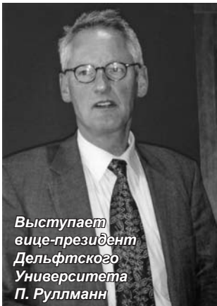
Выступает вице-президент Дельфтского Университета П. Руллманн