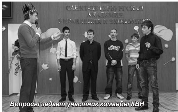
Вопросы задает участник команды КВН