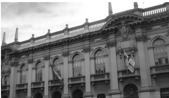
Главное здание Университета Милана, где проходила конференция