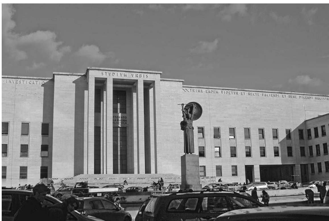
Центральное здание Римского Университета