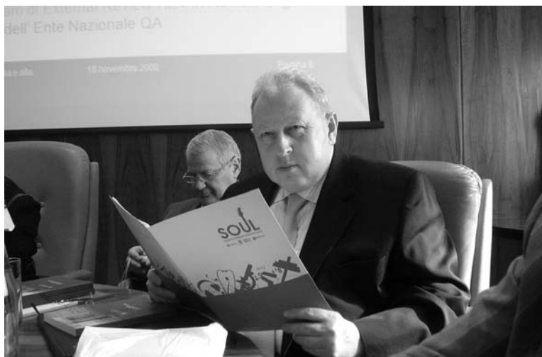
Ректор СПБАУЭ в зале заседаний Римского университета