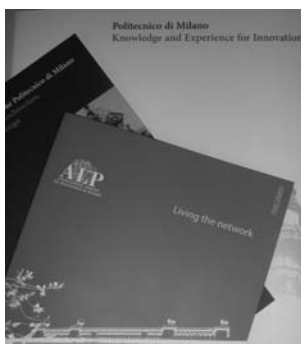
Учебные программы Политехнического университета Милана