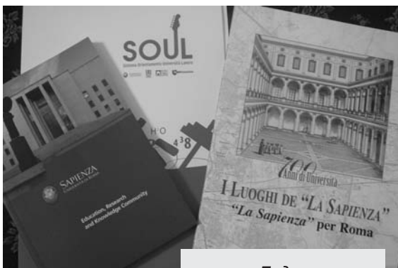
Подарки римских коллег