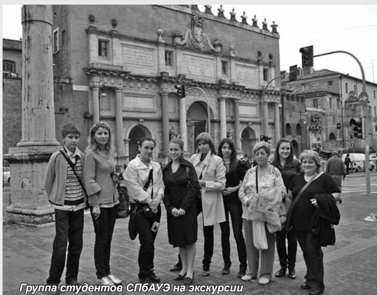
Группа студентов СПБАУЭ на экскурсии