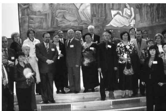
Члены российской делегации в актовом зале Университета Рима