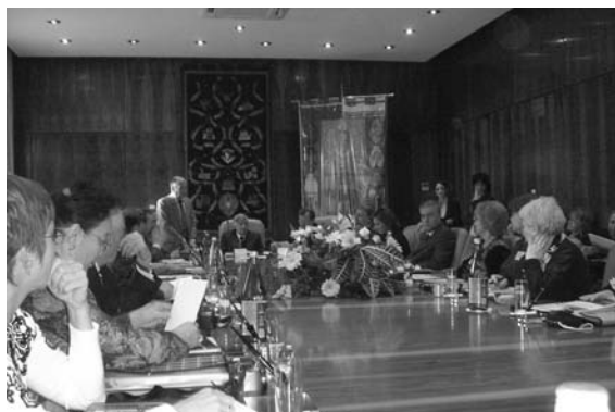
В зале заседаний Римского Университета