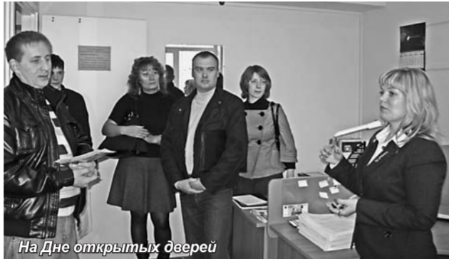
На Дне открытых дверей