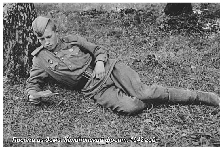
Письмо из дома. Калининский фронт. 1942 год

Из родного Серова уезжали в Свердловск тридцать человек. Провожали родители, друзья, девушки. Уплывали, оставались позади родные