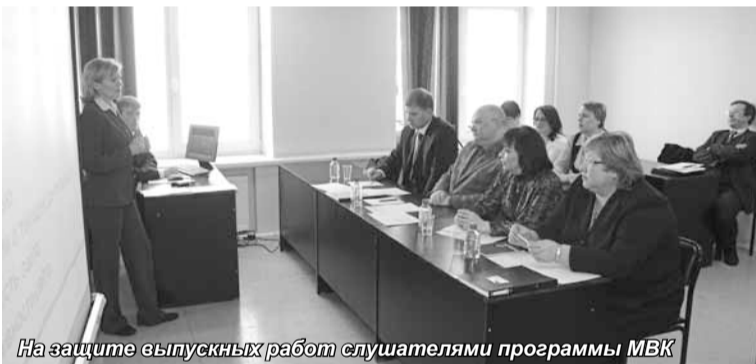
На защите выпускных работ слушателями программы МВА