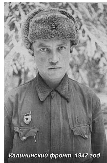
Калининский фронт. 1942 год

По мере готовности полк срочно был направлен двумя эшелонами на Калининский фронт в район Ржева. Враг, отброшенный в декабре, все еще не терял надежды на новый штурм столицы. На станции Нелидово выгрузились и сразу получили боевую задачу. «Катюши» внезапно появлялись у передовой и при ведении залпового огня под густой шум вылетающих ракет, при необходимости - до ста, из нескольких установок в течении пяти - десяти секунд наносили сокрушительный удар по позициям врага. Одновременно с залпом над установками поднимался черно-белый дым, он то и служил для вражеских артилле-