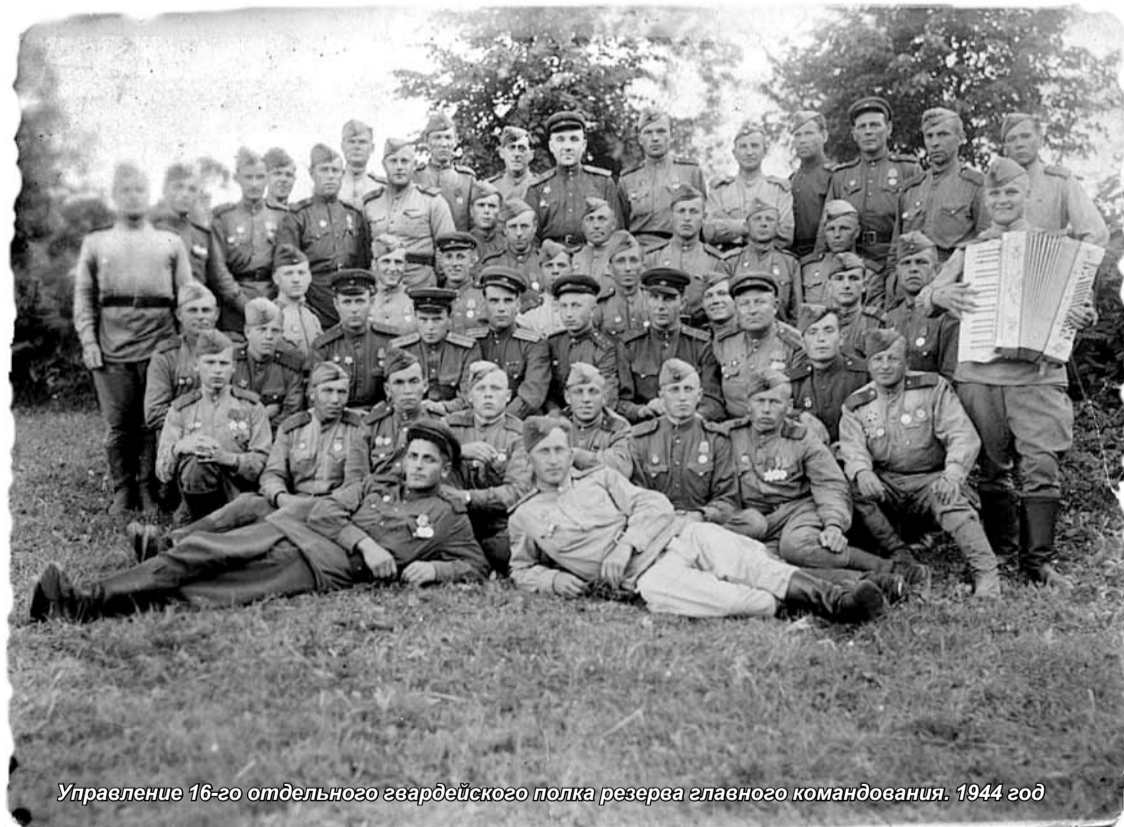
Управление 16-го отдельного гвардейского полка резерва главного командования. 1944 год

Вне боя, под охраной роты саперов, зачехленные установки ждали своего часа в специально открытых укрытиях. Реактивные минометы относились к особо секретному виду оружия, охрана была строжайшая.