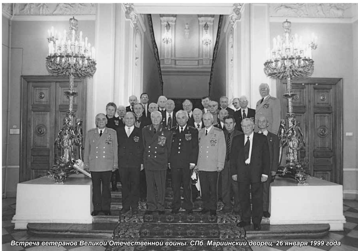
Встреча ветеранов Великой Отечественной войны. СПб. Мариинский дворец. 26 января 1999 года