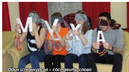
Один из конкурсов – составить слово