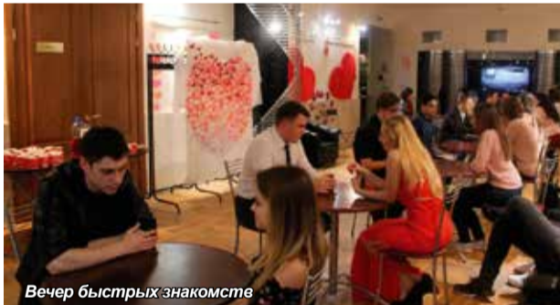
Вечер быстрых знакомств

Для молодежи провели мастер-класс по этикету, а затем состоялся вечер быстрых знакомств. В стенах Дома молодежи подобный формат вечеринки был представлен впервые и, судя по бурным овациям, пришёлся студентам по вкусу.