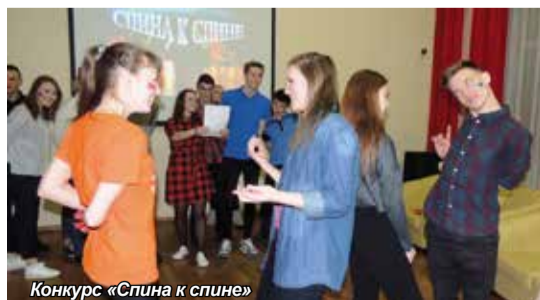
Конкурс «Спина к спине»