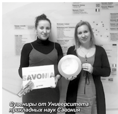
Студенцы от Университета прикладных наук Савония