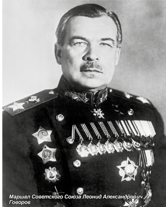
Маршал Советского Союза Леонид Александрович Говоров

Накануне Дня защитника Отечества исполняется 120 лет со Дня рождения маршала Советского Союза Леонида Александровича Говорова. Он занимает значимое место в числе видных советских военачальников Великой Победы над германским фашизмом. Про таких можно с полным правом сказать – защитник Отечества. И все-же, почему мы сегодня вспомнили именно о нем? Ведь героев Великой Отечественной войны много –