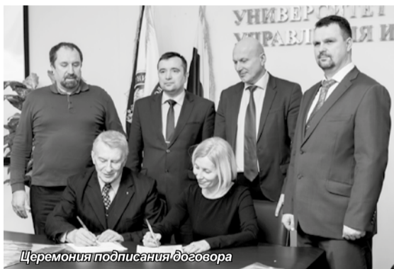
Церемония подписания договора