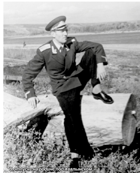
В отпуске на родине под Хвалынском

Из статьи Л.А. Говорова, написанной в ноябре 1942: «Высока честь и велика ответственность защищать Ленинград –