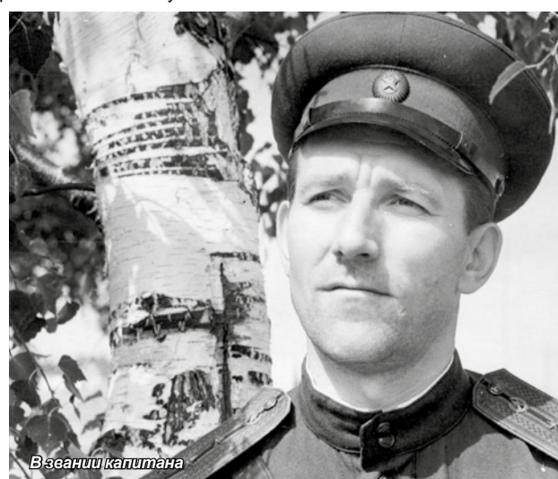
В звании капитана