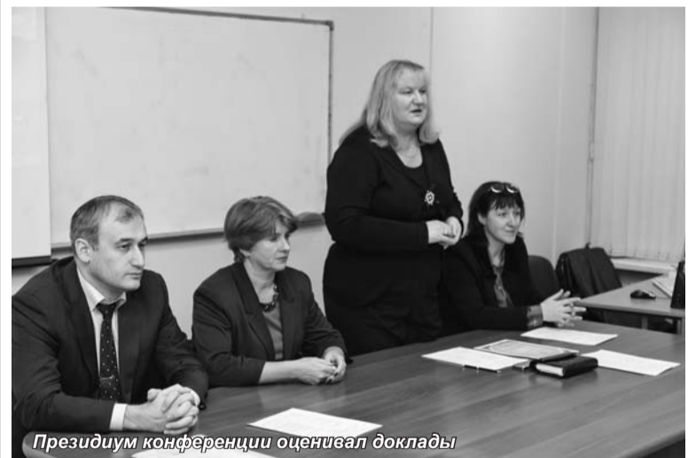
Президиум конференции оценивал доклады

Большинство докладов на конференции было представлено в форме презентации. Президиум конференции, внимательно выслушав и оце-