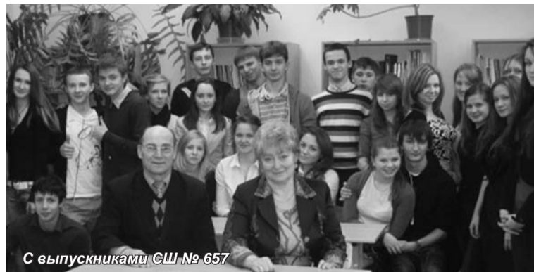
С выпускниками СШ № 657