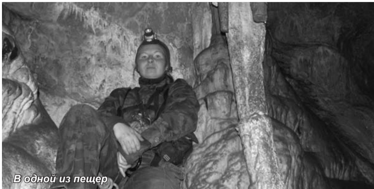
В одной из пещер

Что должен знать специалист в сфере социально-культурного сервиса и туризма о путешествиях? Все! А что ему необходимо уметь? Тоже все! А где и когда наши знания можно проверить? Только на практике!!! Да здравствует практика! Мы поднимаемся в горы, чтобы спуститься в пещеры.