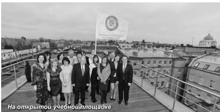
На открытой учебной площадке

27 декабря в Санкт-Петербургском университете управления и экономики состоялось торжественное открытие зала приемов-переговоров и академической мобильности и учебной площад-