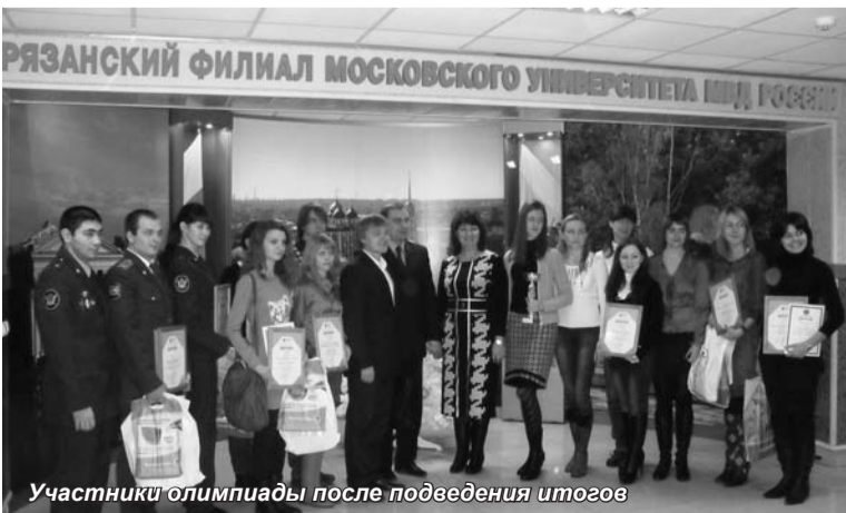
Участники олимпиады после подведения итогов