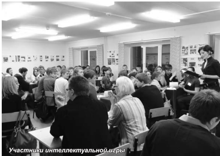
Участники интеллектуальной игры

«...И восстановится могущество былое, И процветающей должна Россия стать, Когда такие славные герои Смогли родную землю отстоять...»