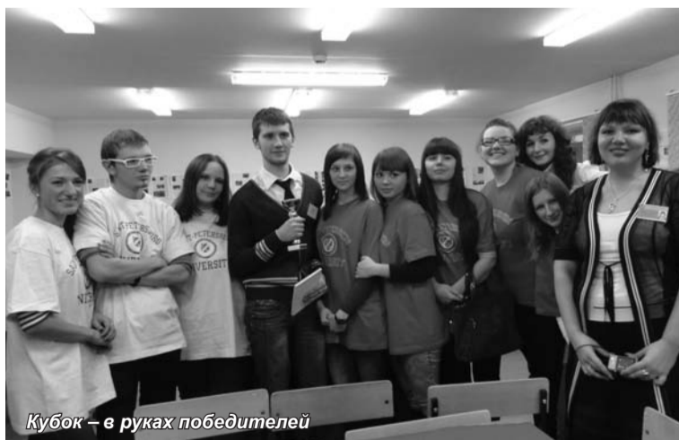
Кубок – в руках победителей

После игры преподаватели, студенты, школьники еще долго общались, рассматривали подготовленные кафедрой фотографии и исто-