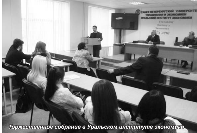
Торжественное собрание в Уральском институте экономики

Санкт-Петербургскому университету управления и экономики более 20 лет, из них 15 лет работает институт в Екатеринбурге, который занимает достойное место среди региональных структурных подразделений Университета.