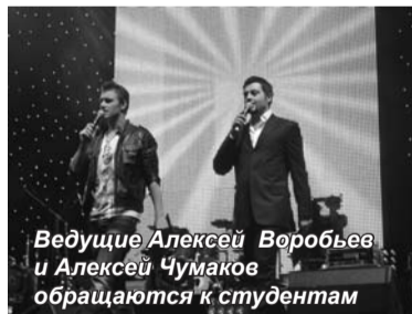
Ведущие Алексей Воробьев и Алексей Чумаков обращаются к студентам

В конце минувшего года в Санкт-Петербурге состоялась антинаркотическая акция «Пацаны! Вам это не надо!». Ее цель – информировать молодежь о реальной угрозе наркотической зависимости и пропагандировать здоровый образ жизни.