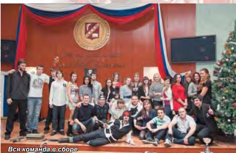
Вся команда в сборе