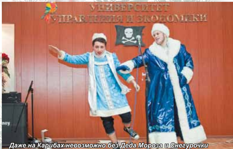
Даже на Карибах невозможно без Деда Мороза и Снегурочки

теплых краях. Ну, к примеру, на Карибах. Мечта попасть туда для вас неосуществима? Да ничего подобного! Просто надо в нужное время оказаться в нужном месте. Все