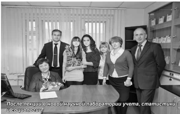
После лекции в новой научной лаборатории учета, статистики и социологии