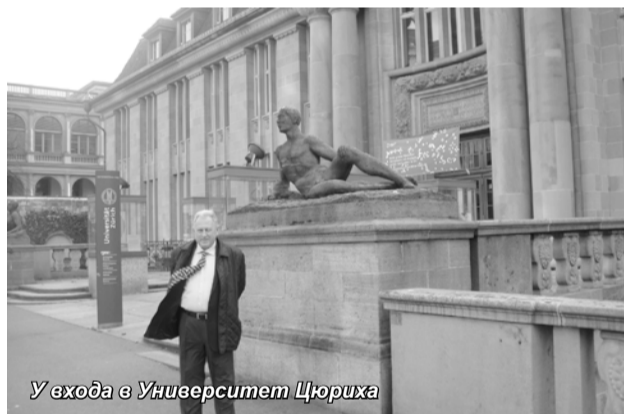
У входа в Университет Цюриха

ропейском образовании, которые отражают новые фундаментальные процессы на рынке труда, вызванные гло-