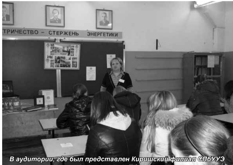
В аудитории, где был представлен Киришский филиал СПбУУЭ

Совсем недавно у нас в Киришах прошла образовательная ярмарка. А 23 ноября у наших соседей, в городе Тихвине, состоялось подобное мероприятие. Киришский филиал разослал письма в центры занятости области, и Тихвинский центр занятости населения совместно с Комитетом по образованию Администрации Тихвинского района пригласили