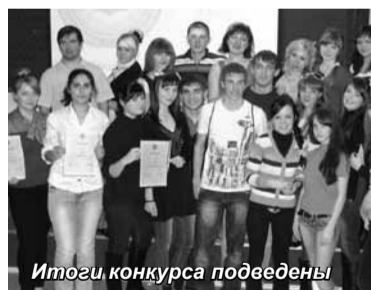
Итоги конкурса подведены