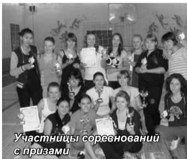
Участницы соревнований с призами

Кафедра физического воспитания регулярно проводит спортивно-массовые мероприятия, которые проходят в рамках Спартакиады. 25 ноя-