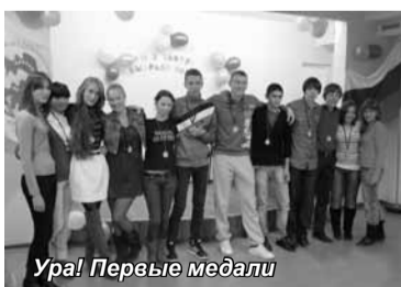
Ура! Первые медали

25 ноября Калининградский институт экономики отметил радостное событие – День первокурсника! Первокурсники проучились уже почти 2 месяца и успели с головой окунуться в студенческую жизнь. «Творческий экзамен» им организовали второкурсники. В качестве подарка первокурсникам студенты старшего курса исполнили лиричную песню, создав праздничную атмосферу в зале. Праздник сту-