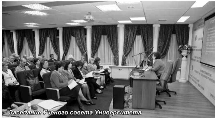
Заседание Ученого совета Университета

В Санкт-Петербургском университете управления и экономики 13 декабря состоялось расширенное заседание Ученого совета, участниками которого стали директора региональных институтов и филиалов, собравшиеся на совещание по вопросам предстоящей аккредитации на период с 13 по 14 декабря. На заседании были подведены основные итоги деятельности в 2011-2012 учебном году и обсуждались задачи Университета на период до 2013 года в соот-