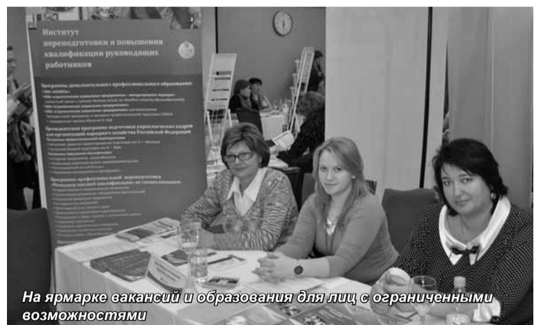
На ярмарке вакансий и образования для лиц с ограниченными возможностями

Фундаментом эффективности дистанционного обучения является выбор места и времени студентом для изучения дисциплин: основной контингент обучающихся по этой форме – люди, которые по каким-либо причинам не могут ездить в Университет. Так, например, Институт разработки и внедрения дистанционных технологий и инновационного обучения принял участие в мероприятии под названием «Ярмарка вакансий и образования для инвалидов и лиц с ограниченными возможностями». Желающих обучаться именно на такой форме было не мало!