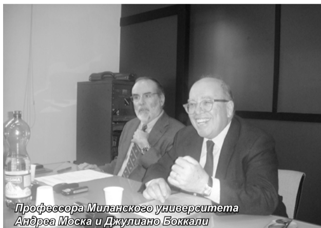
Профессора Миланского университета Андреа Моска и Джулиано Боккалли