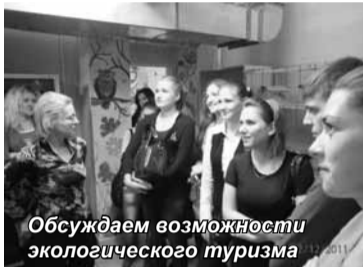
Обсуждаем возможности экологического туризма

Нам очень хочется, чтобы жизнь в Токсовском лесу наладилась, а сказка продолжалась. Каждый из нас может способствовать этому. Для этого надо, во-первых, знать и гордиться наличием такого объекта, а во-вторых, обязательно находить время для посещения этого леса. Это нужно, чтобы сделать глоток свежего воздуха, подвигаться и поиграть в сказочные игры (даже если возраст уже, по мнению некоторых, далек от того, когда игра была основной жизненной интересом). Там можно принять участие в играх-путешествиях «Лес, словно терем расписной», «Путешествие с дракончиком», «Ожерелье феи Осени», «Волчья стая (Маугли)», «Богатырская игра», услышать концерт исполнителей музыки на кельтских арфах, побывать на представлении театра зверей. Как видно из названий, многие предла-