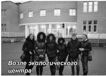
Возле экологического центра

Туризм в современном мире – доходная отрасль большого бизнеса. В ней занят каждый десятый работник в мире. По оценкам Всемирной туристской организации (UNWTO) доходы отрасли составляют более 1,5 трлн. долларов в год. Как отдельное направление в мощной туристской сфере бизнеса выделился в последние десятилетия экологический туризм. Данный вид туризма призван минимизировать ущерб окружающей среде, он имеет как воспитательное, так и рекреационное значение. Во всем мире специалисты признают его одним из самых динамично развивающихся видов туризма. Термин «экологический туризм» стал активно использоваться в туристском бизнесе с начала 80-х годов прошлого века. В настоящее время по различным оценкам экологический туризм составляет 10–20% от всего рынка мирового туризма.