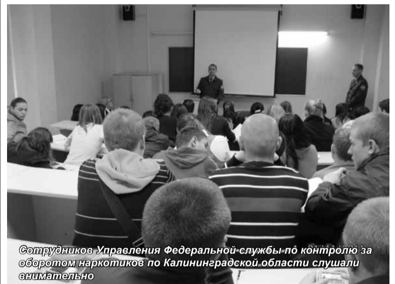
Сотрудников Управления Федеральной службы по контролю за оборотом наркотиков по Калининградской области слушали внимательно

21 ноября состоялась встреча студентов очного отделения Калининградского института экономики с сотрудниками Управления Федеральной службы по контролю за оборотом наркотиков по Калининградской области.