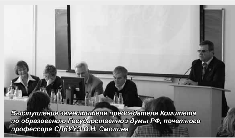
Выступление заместителя председателя Комитета по образованию Государственной думы РФ, почетного профессора СПбУЭ О.Н. Смолина

Внеочередное совещание руководителей учреждений негосударственного образования, посвященное состоянию законодательства о негосударственном образовании и перспективам его совершенствования состоялось 3-4 октября в Российском новом университете (РосНОУ). Мероприятие было организовано по инициативе Экспертного совета Комитета по образованию Государственной думы РФ; Совета Ассоциации негосударственных высших учебных заведений России (АНВУЗ) и рабочих групп АНВУЗа и Экспертного совета по негосударственному образованию. На совещании обсуждались итоги и последствия парламентских чтений по проекту ФЗ № 542091-5 «О контрольных цифрах приема», было предложено внести изменения и дополнения в проект ФЗ «Об образовании».