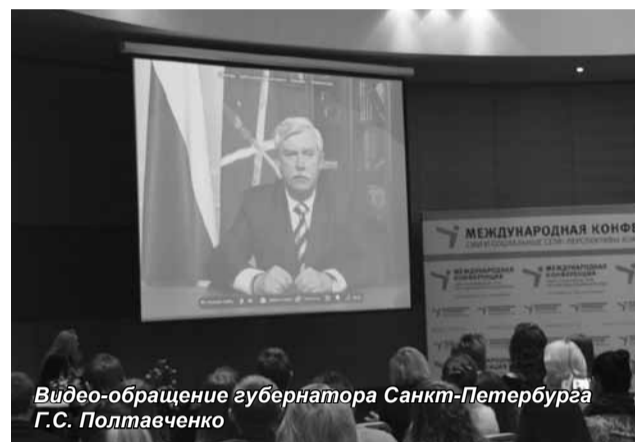
Видео-обращение губернатора Санкт-Петербурга Г.С. Полтавченко

Студенты и преподаватели кафедры «Связи с общественностью» приняли участие в работе международной конференции «СМИ и социальные сети: перспективы взаимодействия», которая состоялась 26 сентября в Санкт-Петербурге, в конференц-центре гостиницы «Прибалтийская Park Inn».