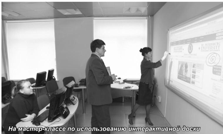
На мастер-классе по использованию интерактивной доски

пулярностью курс «Эффективное использование возможностей PowerPoint в профессиональной и научной деятельности». Курс проходит полностью в виртуальной среде, что позволяет принимать в нем участие большому количеству слушателей, желающих усовершенствовать свои знания в этой области.