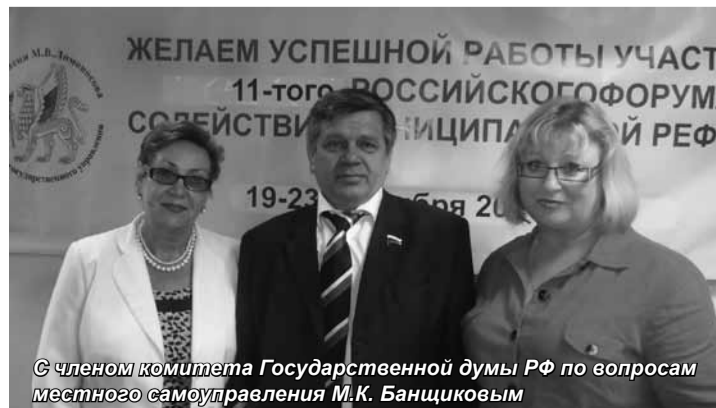
С членом комитета Государственной думы РФ по вопросам местного самоуправления М.К. Банщиковым