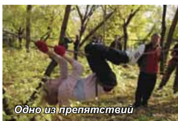
Одно из препятствий

А 27 сентября праздник продолжился в институтском сквере. Его территория превратилась в полосу препятствий, имитирующих те сложности, с которыми можно столкнуться, отправляясь в поход по сибирской тайге. Команды, сформированные из числа студентов Красноярского института экономики и Краснояр-