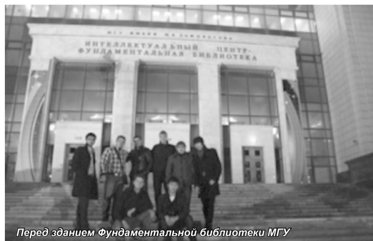
Перед зданием Фундаментальной библиотеки МГУ