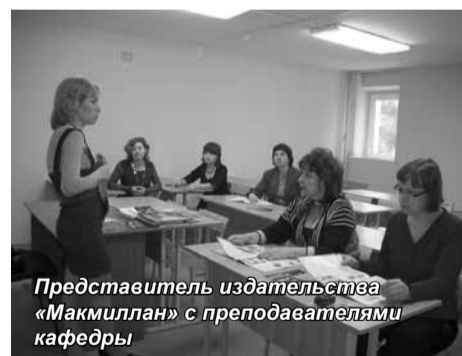
Представитель издательства «Макмиллан» с преподавателями кафедры

В конце сентября в Санкт-Петербургском университете управления и экономики прошла презентация книжных новинок издательства «Макмиллан» (Macmillan).