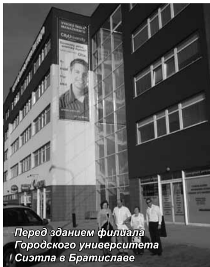
Перед зданием филиала Городского университета Сиэтла в Братиславе