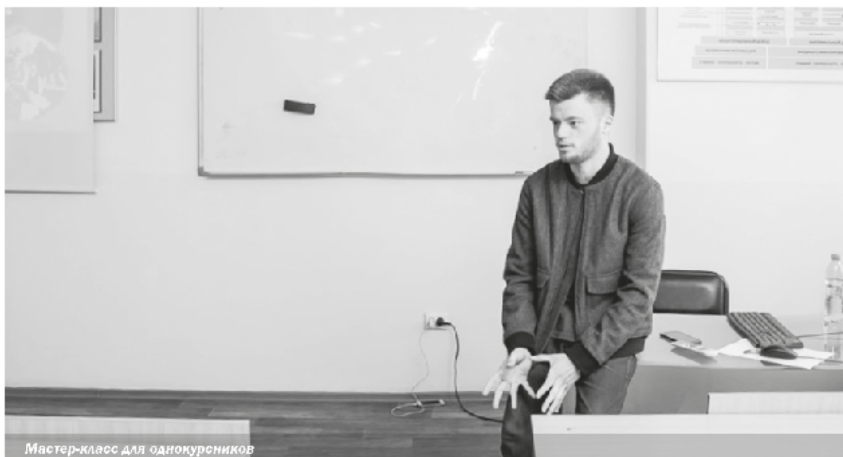
Мастер-класс для однокурсников

получать знания и зарабатывать опыт. Он активно принимал участие во многих мероприятиях, и еще во время учебы проводил мастер-классы для своих однокурсников и студентов младших курсов.