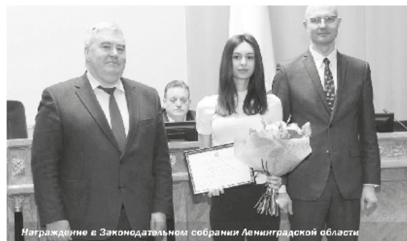
Награждение в Законодательном собрании Ленинградской области