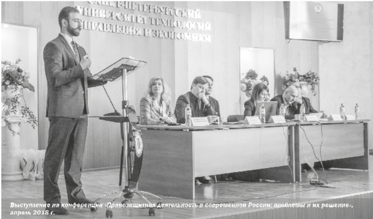
Выступление на конференции «Правозащитная деятельность в современной России: проблемы и их решение», апрель 2018 г.

Профессия юриста связывает служителей закона: адвоката, прокурора, судью, следователя, юрисконсульта, нотариуса, юриста-международника – все они считаются знаками в одной из областей права.