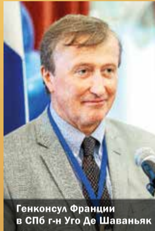
Генконсул Франции в СПб г-н Уго Де Шаваньяк