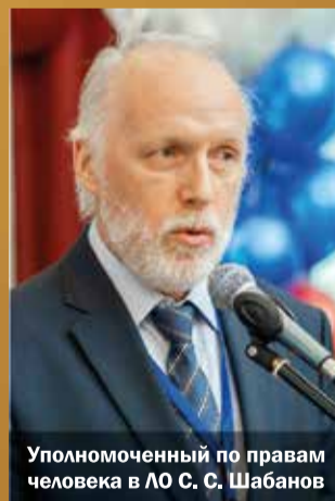
Уполномоченный по правам человека в ЛО С. С. Шабанов